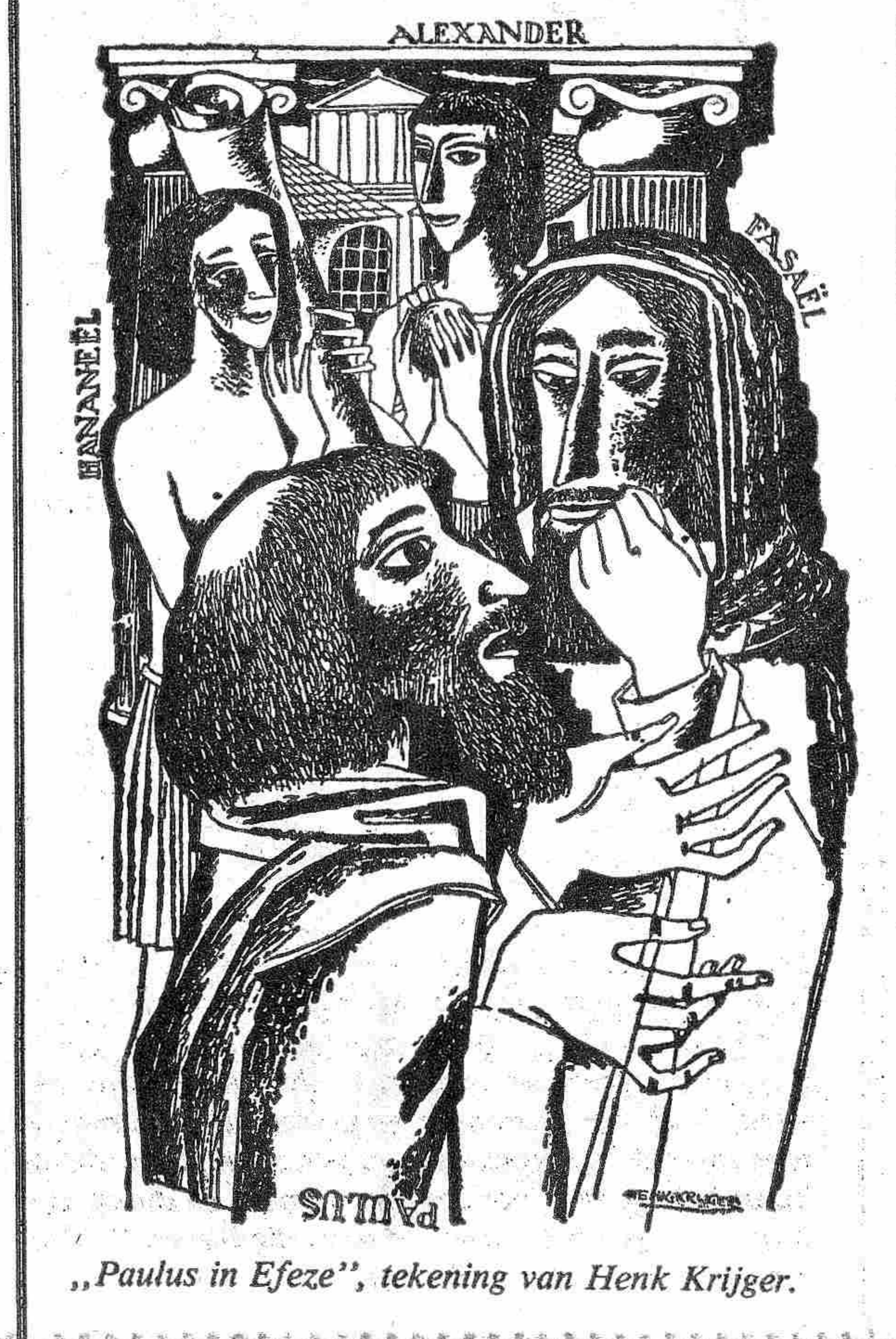
„Paulus in Efeze”, tekening van Henk Krijger.

„Schuchter” naast de brief van Paulus, Gelijkwaardig. Waar is hier sprake van geïnspireerde taal?